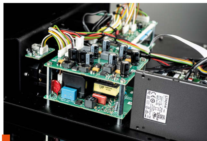
Dobry zasilacz impulsowy w urządzeniu tego typu to rzecz niemal oczywista. Chodzi także o wydajność.